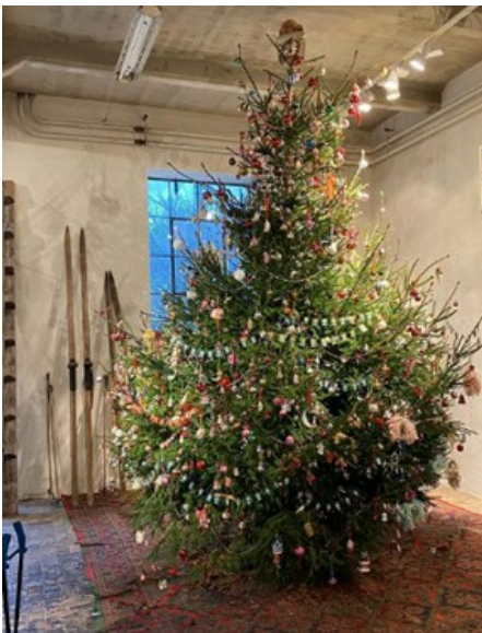
Den ståtliga julgranen i Blå Hallen, Höganäs

Klicka här för att läsa brevet i din webbläsare