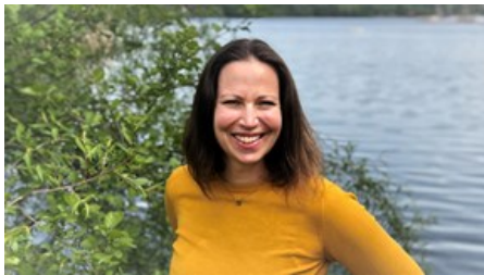
Sanna Ameln