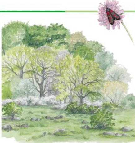
Illustration: BrizaNatur, 2022