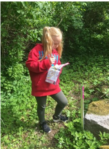
På jakt efter Hittaut-kontroller på Kjugekull.

det som ett kvitto på allt arbete vi har lagt ner i projektet.